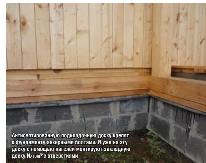
Антисептированную подкладочную доску крепят к фундаменту анкерными болтами. И уже на эту доску с помощью нагелей монтируют закладную доску Naturi® с отверстиями

О монтаже на строительной площадке. Для сооружения домов по системе Naturi специалисты рекомендуют использовать ленточный тип фундамента, либо монолитную плиту. По верхней части его цоколя укладывают гидроизолирующий материал в два слоя, а поверх него – антисептированную подкладочную доску, которую крепят к фундаменту анкерными болтами. А уже на эту доску с помощью нагелей монтируют закладную доску Naturi® с отверстиями, куда в шахматном порядке устанавливают деревянные нагели П25 мм. Вертикальные компоненты ограждающей конструкции, равные по длине высоте стены первого этажа, вставляют в нагели, закрепляя между собой по системе «паз-планка». А монтаж межэтажных перекрытий уже в своем стандартном исполнении ничем не отличается от таких же работ в любом другом деревянном доме. Как показывает практика, монтаж стен дома площадью около 200 кв.метров бригадой из 3-4 человек занимает около 20 дней, что позволяет в срок до трех месяцев, включая процесс производства ограждающих конструкций, построить здание под ключ. В России по столь прогрессивной технологии работает компания «ВИСТАСТРОЙСЕРВИС».