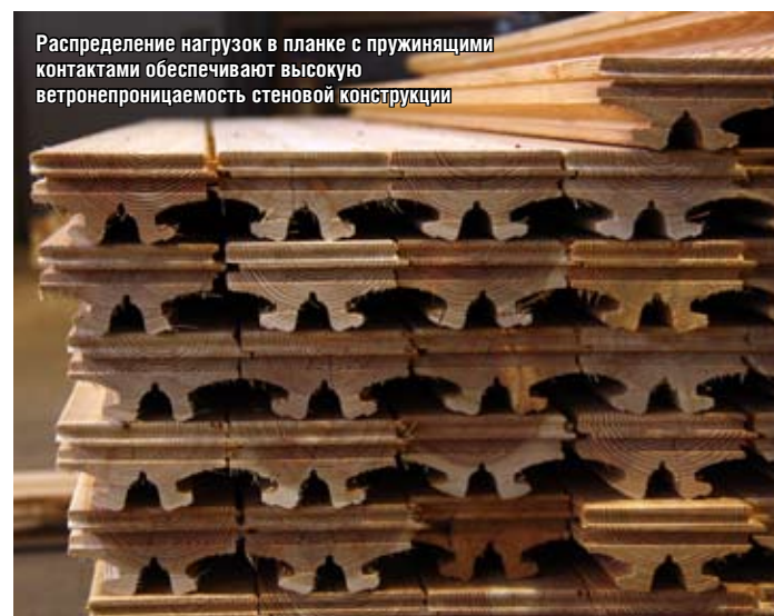
Распределение нагрузок в планке с пружинящими контактами обеспечивают высокую ветронепроницаемость стеновой конструкции