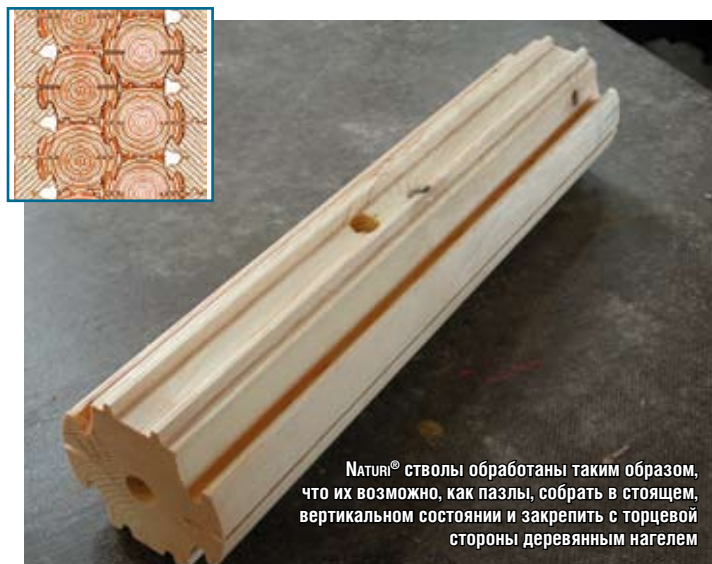
Naturi® стволы обработаны таким образом, что их возможно, как пазлы, собрать в стоящем, вертикальном состоянии и закрепить с торцевой стороны деревянным нагелем

Посмотрите на приведенную схему. Стена Naturi® толщиной 30 см имеет девять соединений паз-планка. Таким